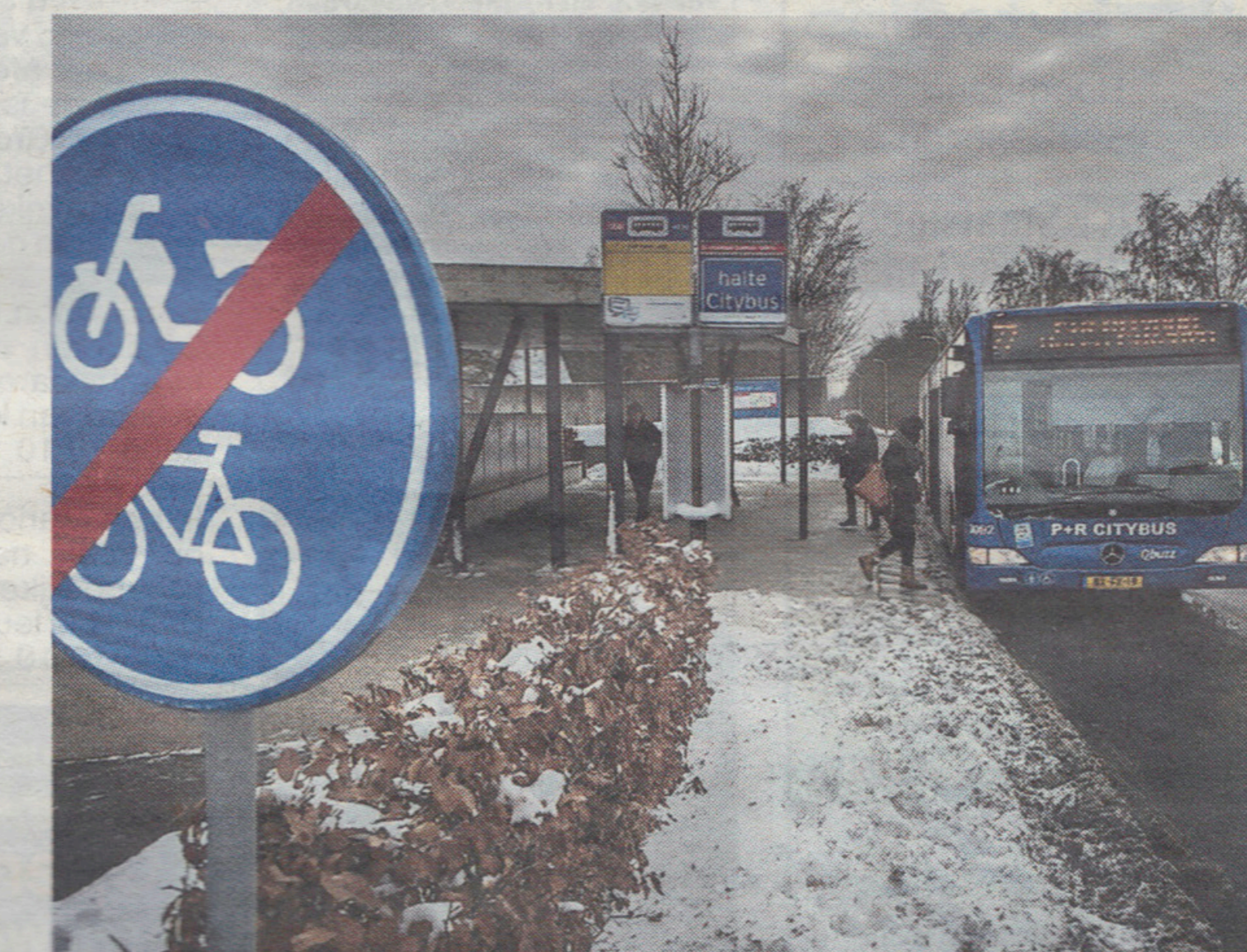
▲ Het Transferium Haren wordt volgend jaar flink groter.

Angst dat drukke automobilisten zichzelf geen tijd gunnen om de garage in te rijden deed het plan, in combinatie met de verwachte kosten, de das om.